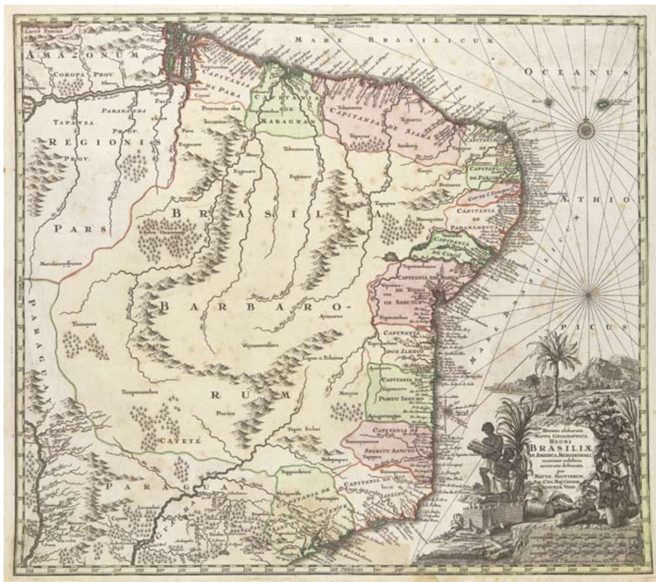
Figura 8 – O “Mappa Geographica Regni Brasiliae” de George Matthäus Seuter (ca. 1735). Os detalhes da ornamentação do cartucho mostram homens e mulheres de pele escura preparando pães-de-açúcar e rolos de fumo, tradicionais produtos agrícolas do país. Instituto de Estudos Brasileiros / USP (acervo depositado temporariamente pela Justiça Federal), São Paulo.