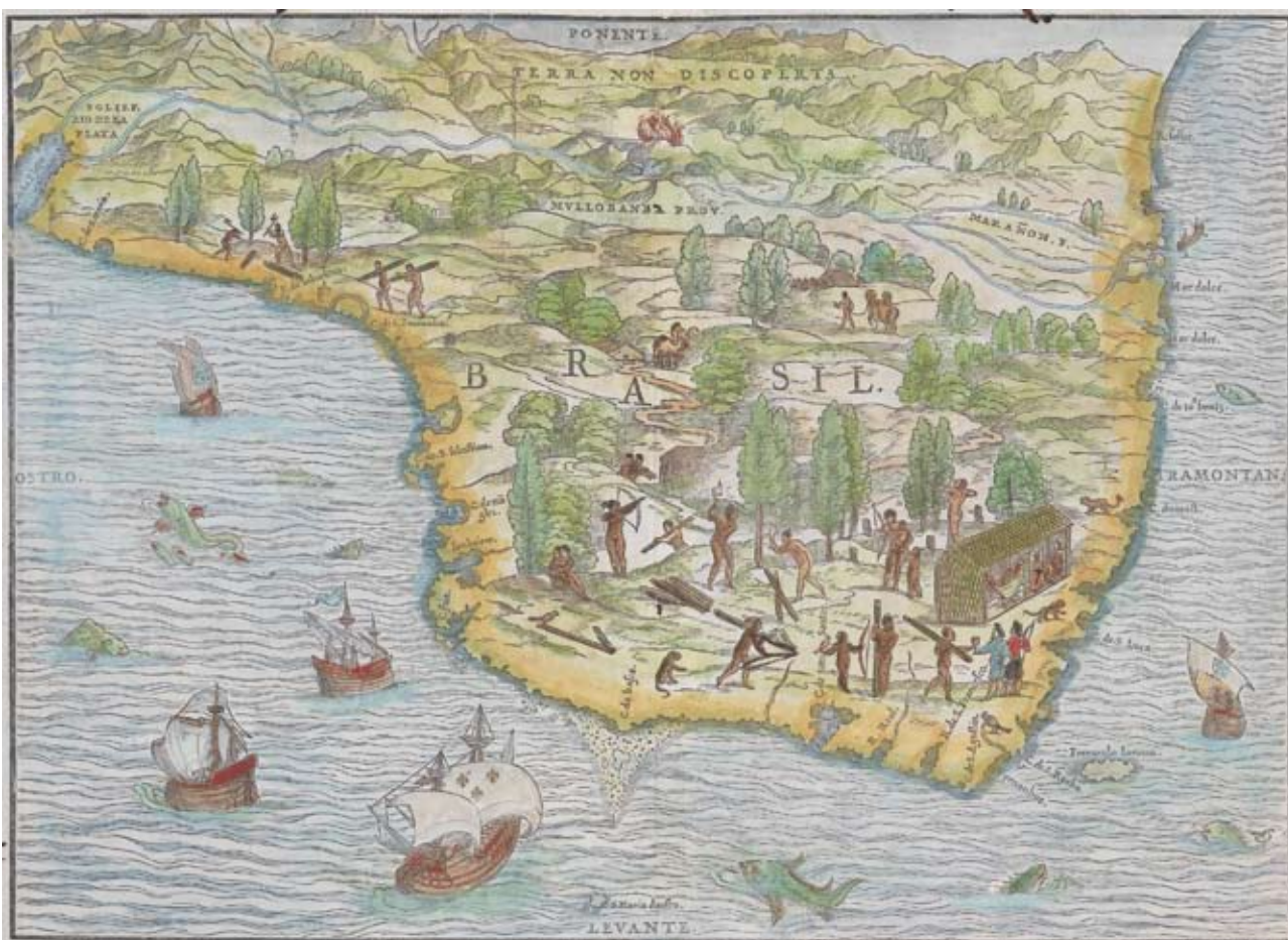
Figura 1 – O Brasil, segundo xilogravura preparada por Giacomo Gastaldi para o terceiro volume da famosa “Delle Navigazioni e Viaggi” de Giovanni Battista Ramusio (1556). Instituto de Estudos Brasileiros / USP (acervo depositado temporariamente pela Justiça Federal), São Paulo.

8. Os psitácidas do Novo Mundo chegariam à Europa poucos anos após a viagem de Colombo, conforme demonstra a imagem de uma arara-vermelha – talvez uma araracanga ( Ara macao ) – presente no “Retrato do Casal Cuspinian”, díptico de Lucas Cranach pintado em Viena entre 1502 e 1503. Por serem bem mais vulgares, entretanto, animais africanos e asiáticos terminariam por substituir os da América em numerosos mapas, trocas que envolviam “macacos”, “papagaios”, “felinos” e outras categorias zoológicas arbitrárias representadas em