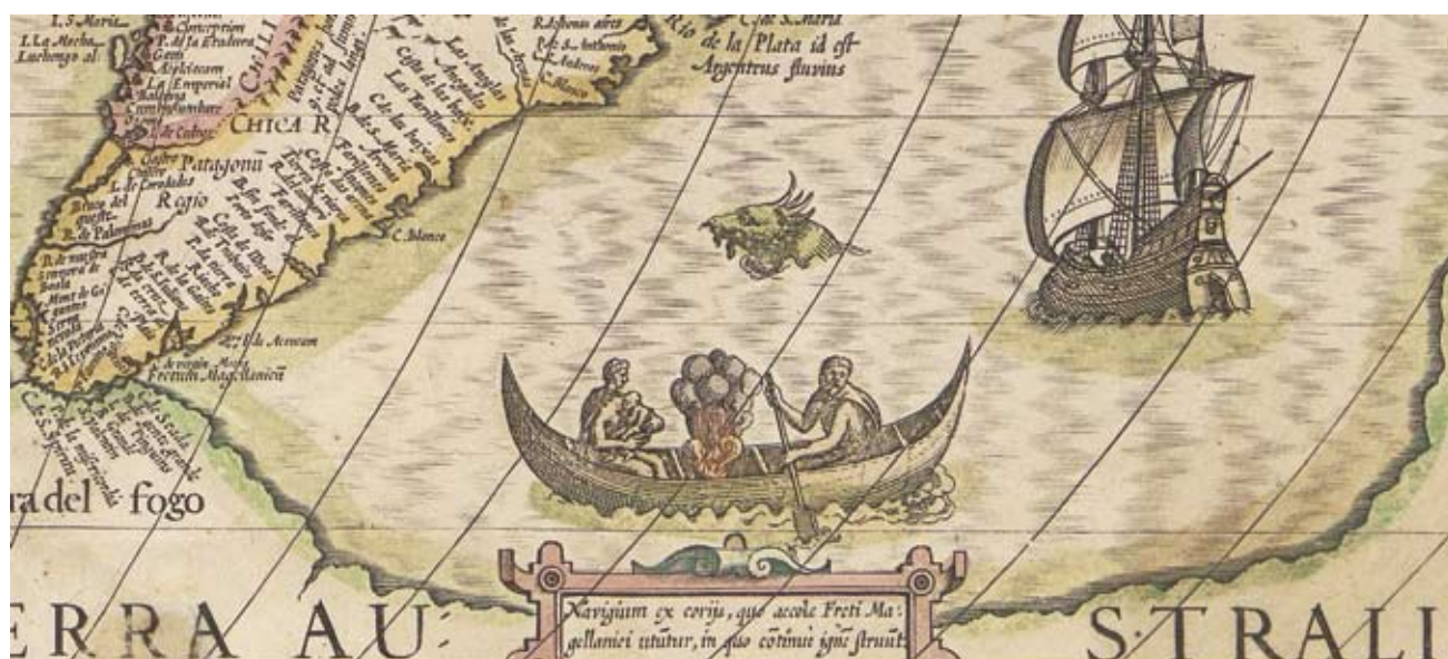
Figura 4 – Canoa alakaluf. Detalhe da “America” de Jodocus Hondius (ca. 1606). Instituto de Estudos Brasileiros / USP (acervo depositado temporariamente pela Justiça Federal), São Paulo.