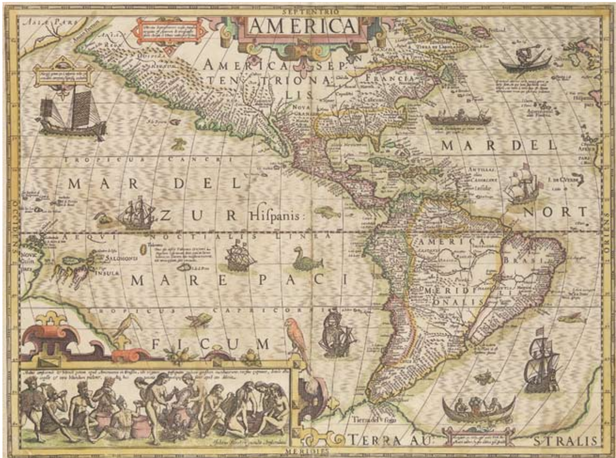
Figura 2 – A “America” de Jodocus Hondius (ca. 1606). Instituto de Estudos Brasileiros / USP (acervo depositado temporariamente pela Justiça Federal), São Paulo.

Ao lado das proverbiais araras e tucanos, a “America” de Hondius apresenta ilustrações bem mais elaboradas, por exemplo uma cena de costumes alusiva ao preparo do cauim por índios brasileiros calcada na versão das gravuras originais de André Thevet vinda à luz no terceiro volume das “Grandes Viagens” de Theodore de Bry (Figura 3) 25 . Próxima ao sul do continente, uma segunda figura menos