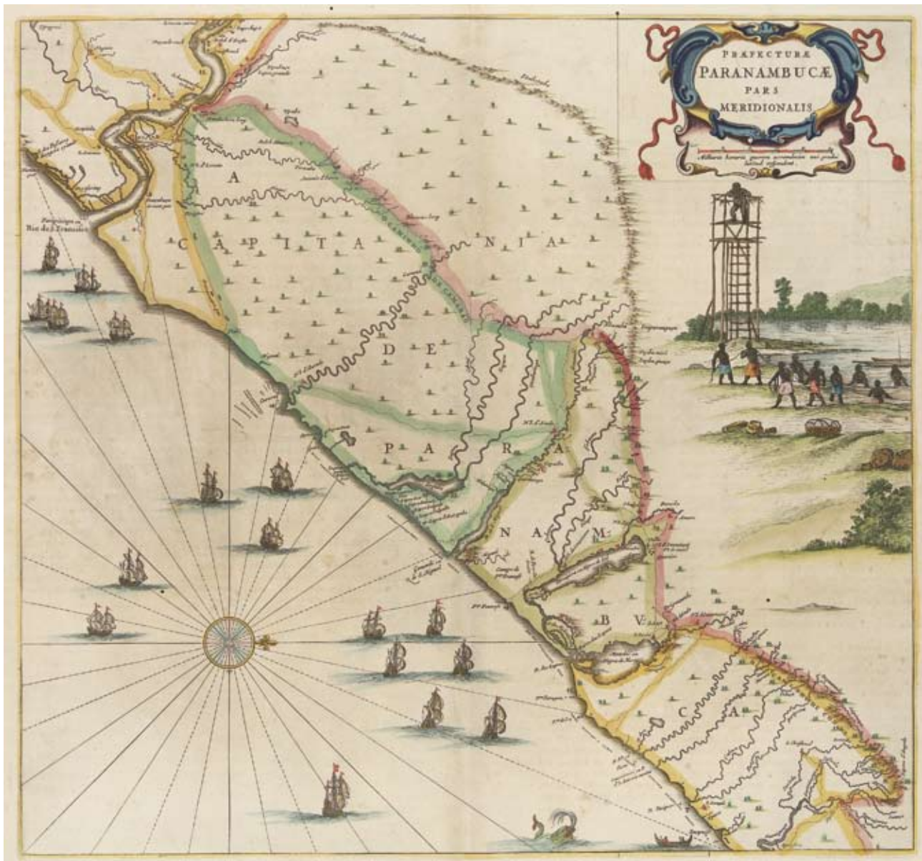
Figura 6 – Parte do “Mapa de Marcgrave” publicada no “ Rerum per Octennium in Brasilia ” de Gaspar Barlaeus (1647).