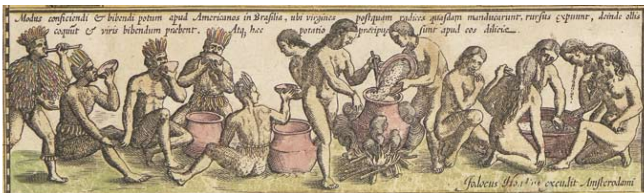
Figura 3 – Índios preparando e consumindo o cauim. Detalhe da “America” de Jodocus Hondius (ca. 1606).

conspícua mostra uma família de indígenas seminus aquecendo-se nas chamas de uma fogueira acesa no bojo de uma frágil embarcação (Figura 4). Encontrado em outros mapas do mesmo autor, esse curioso detalhe diz respeito aos primeiros contatos com os Alakaluf, nação de índios canoieiros do Estreito de Magalhães e arredores mencionada por cerca de 16 relatos dos séculos XVI e XVII 26 .