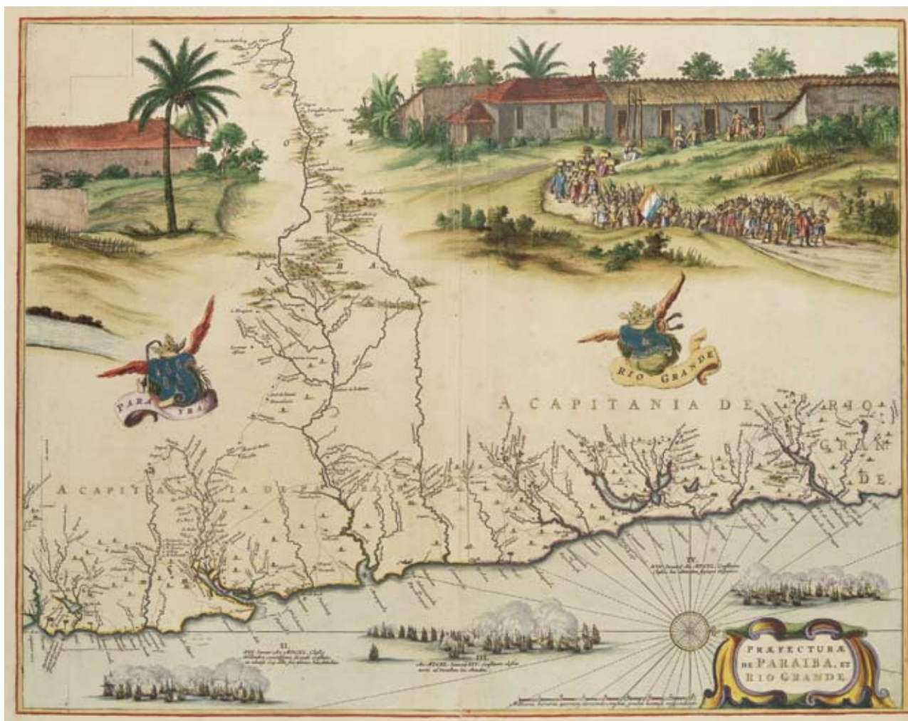
Figura 7 – Parte do “Mapa de Marcgrave” publicada no “ Rerum per Octennium in Brasilia ” de Gaspar Barlaeus (1647). Instituto de Estudos Brasileiros / USP (acervo depositado temporariamente pela Justiça Federal), São Paulo.

primeiro contato efetivo com os Alakaluf ocorreria apenas seis anos mais tarde, durante a expedição do Frei Garcia Jofre de Loayasa (in G. F. Oviedo y Valdez, 1557). Quanto à origem da figura presente no mapa de Jodocus Hondius, vale lembrar que algumas publicações holandesas do começo do século XVII tentariam retratar a fisionomia e certos aspectos da cultura material desses indígenas. Na verdade, as gravuras referentes aos Alakaluf