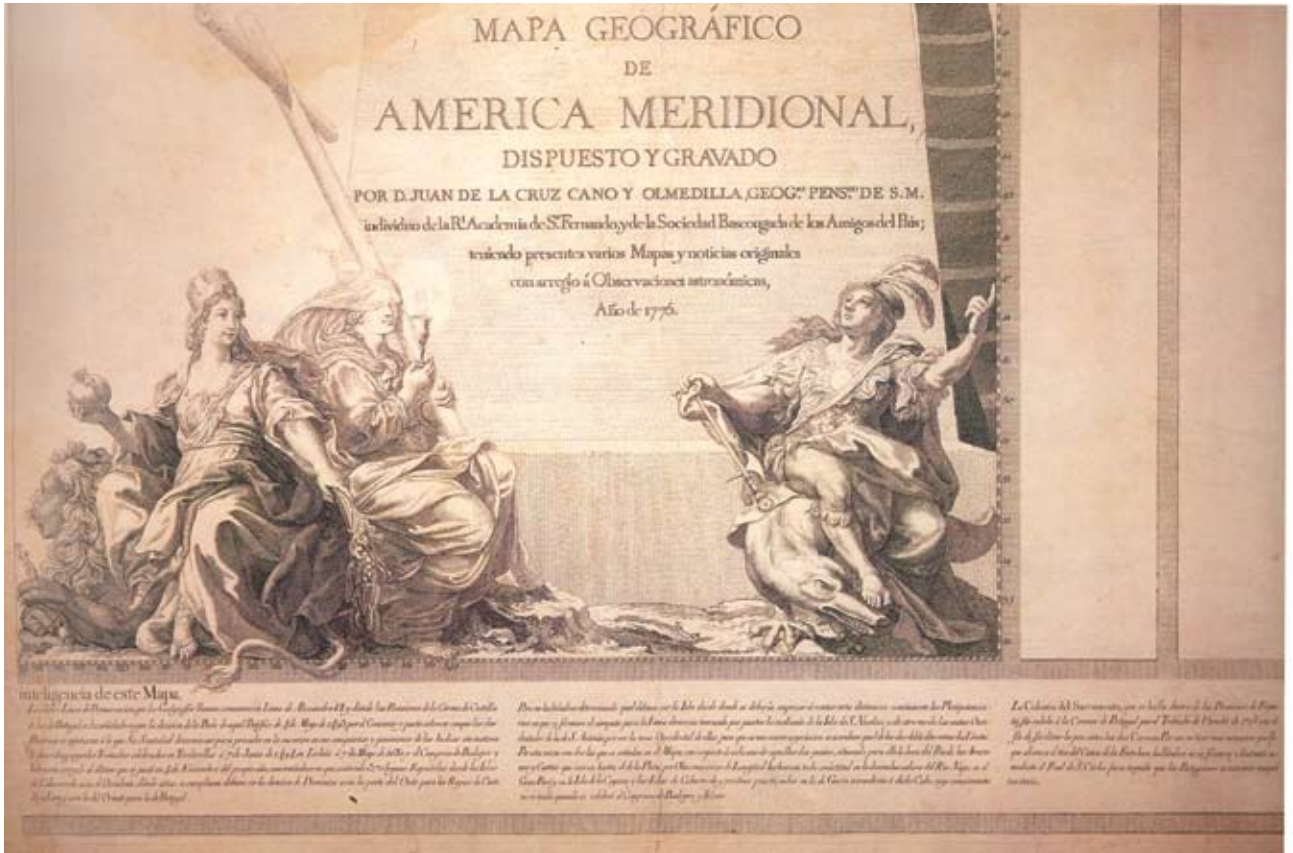
Figura 9 – A Europa e a América. Detalhe do “Mapa Geográfico da América Meridional” de Juan de la Cruz Cano y Olmedilla (1775). Mapoteca do Itamaraty, Rio de Janeiro.

penas, retrato de uma selvagem e desamparada América convocada a ingressar nas luzes da civilização, arranjo coerente com as chamadas “Alegorias dos Quatro Continentes” em voga desde o começo do século XVII 30 .